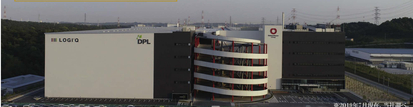
※2019年7月現在、当社調べ。